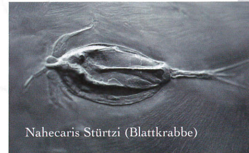
Nahecaris Stürtzi (Blattkrabbe)

Es handelt sich um Funde von im Schiefer eingeschlossenen Lebewesen